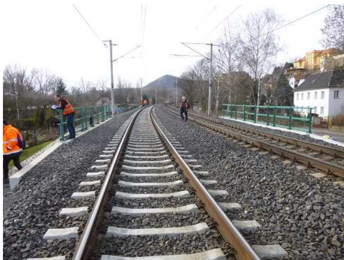
Pohled ve směru staničení